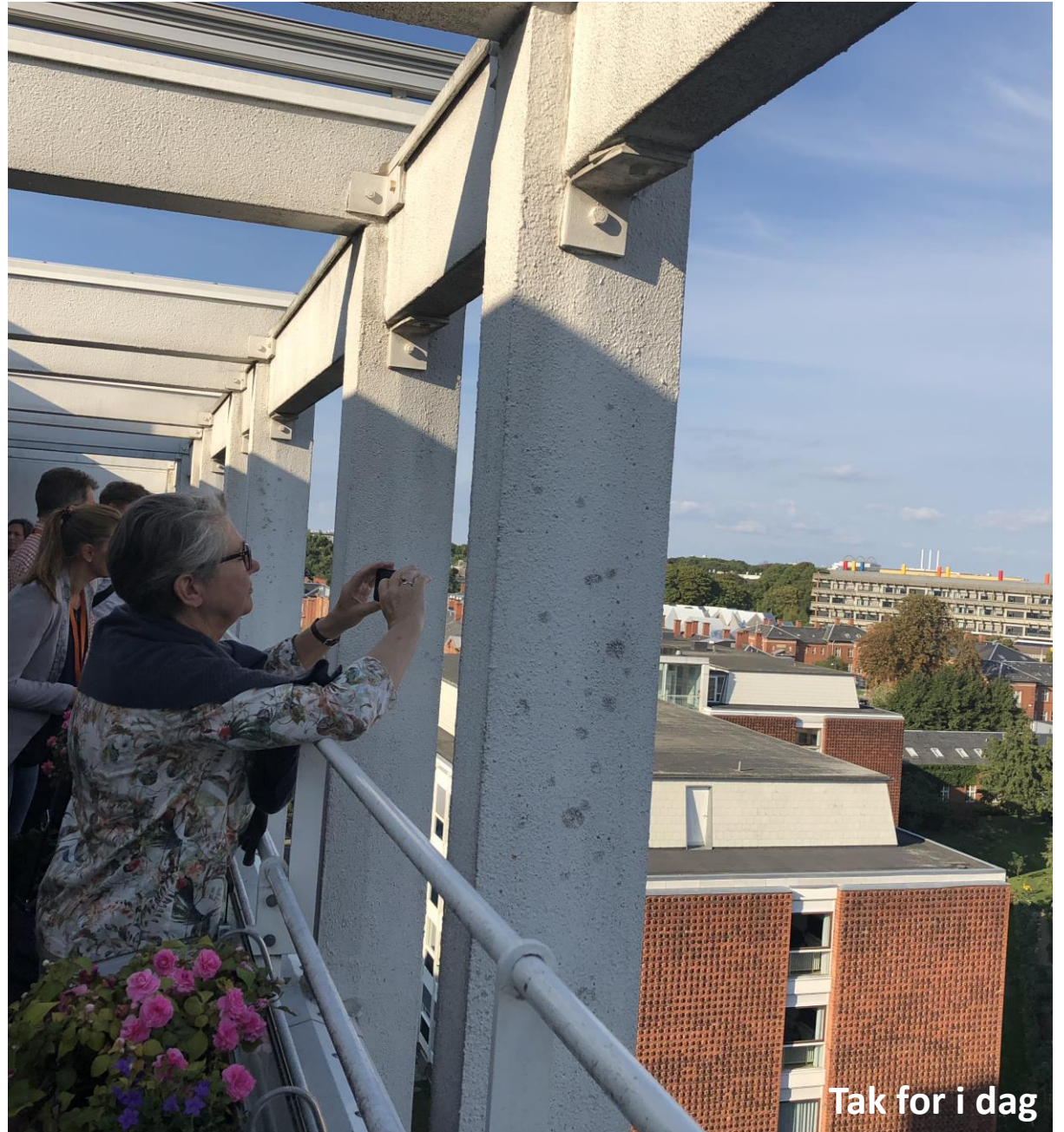
Tak for i dag