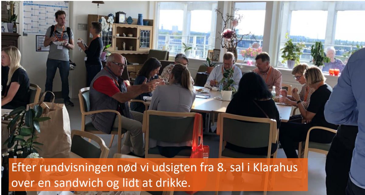
Efter rundvisningen nød vi udsigten fra 8. sal i Klarahus over en sandwich og lidt at drikke.